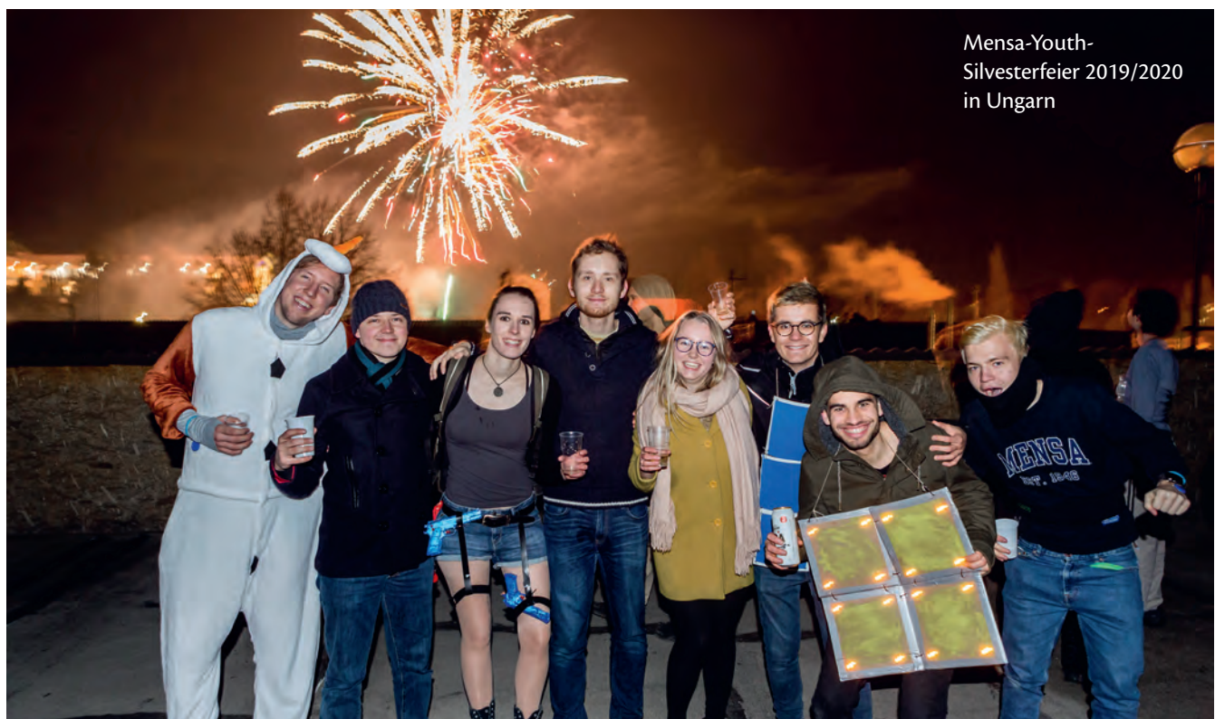
Mensa-Youth- Silvesterfeier 2019/2020 in Ungarn